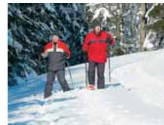
Langlaufvergnügen auf Naturloipen