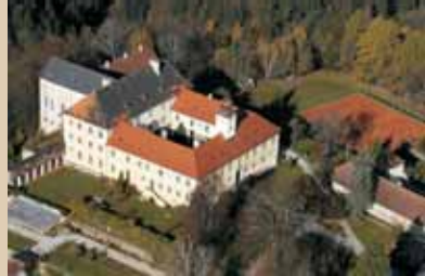
Schloss Altenhof hoch über dem Rannatal und Burgruine Falkenstein