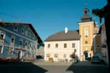
Eindrucksvolles, denkmalgeschütztes Ortsensemble