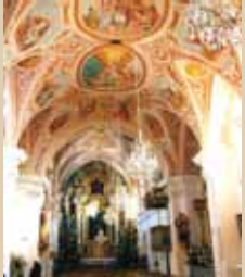
Sehenswerte Barock-Kirche mit "Carlone-Fresken" und Loretokapelle