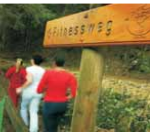
Körperbewusstsein erleben auf dem Fitnessweg rund um den Rannastausee