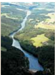
50 km leichte bis anspruchsvolle Wanderwege, eingebunden in das Wanderwegenetz Donau und Böhmerwald sowie in den Jakobsweg