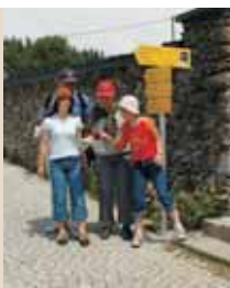
Idyllische Plätze im Naturschutzgebiet Rannatal